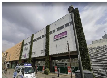
■ スーパー(徒歩10分) blooming bloomy