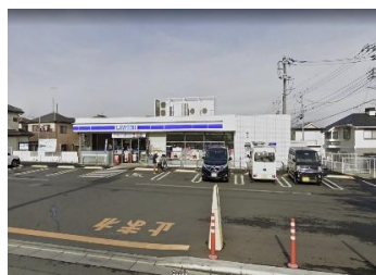
■ コンビニ(徒歩4分) LAWSON