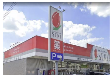
■ ドラッグストア(徒歩10分) ドラッグストア セキ