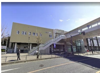
■ 駅(徒歩9分) 西武新宿線「狭山市駅」